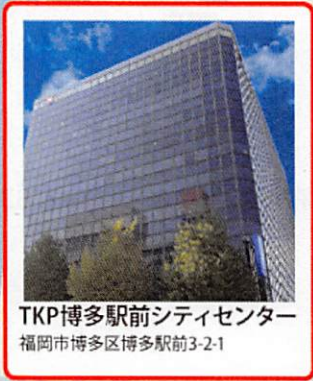
TKP博多駅前シティセンター 福岡市博多区博多駅前3-2-1

TKP博多駅前シティセンター 8階 〒812-0011 福岡県福岡市博多区博多駅前3-2-1 日本生命博多駅前ビル8F TEL: 092-433-2833