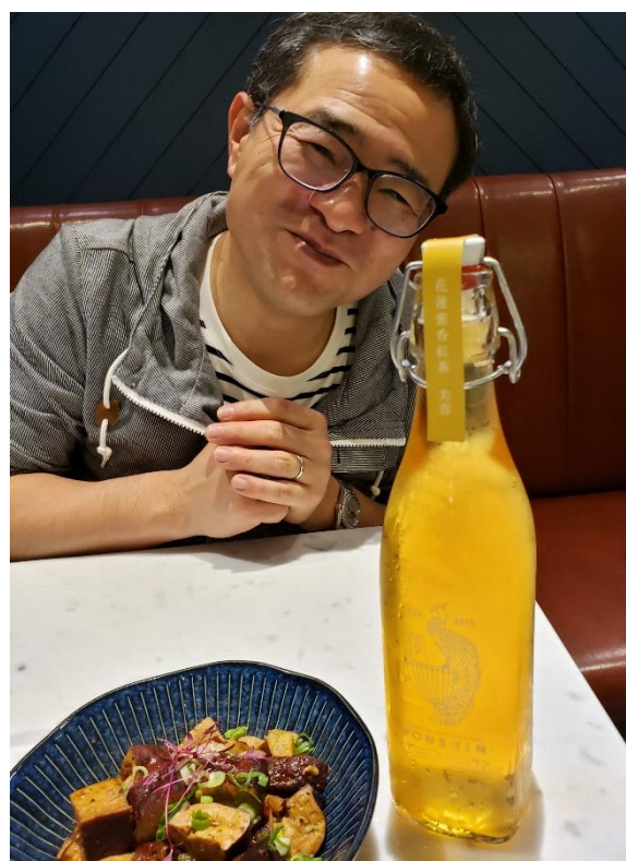
でも本当はビールが飲みたかった。。