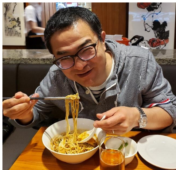
鼎泰豊では担々麺も絶品でした！