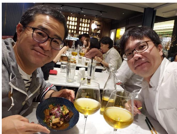
冷茶で優雅にカフェごはん