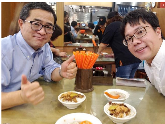
魯肉飯と餛飩湯、二人で300円！